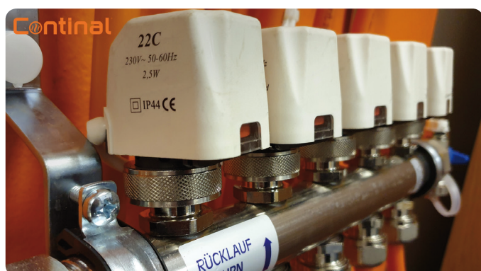
Actuadores de zona HeatMax™