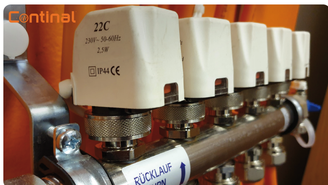
Actuateurs de zones HeatMax™